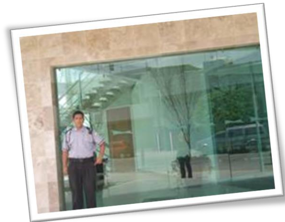
Vigilancia 24 hrs.