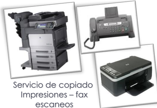
Servicio de copiado Impresiones – fax escaneos