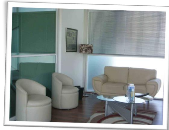
Sala de espera